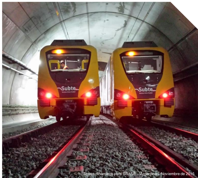
Testes dinámicos para SBASE – Argentina – Noviembre de 2016