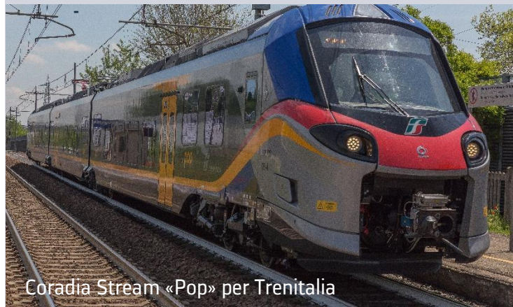
Coradia Stream «Pop» per Trenitalia

Sistema ERTMS Livello 2 per le linee ad alta velocità italiane, le prime in Europa dotate del nuovo standard interoperabile.