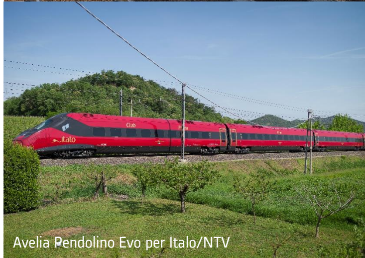
Avelia Pendolino Evo per Italo/NTV