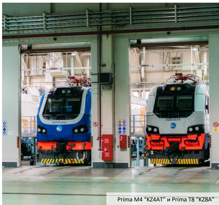
Prima M4 "KZ4AT" и Prima T8 "KZ8A"

Компания Alstom работает в Казахстане с 2010 года со штатом более 1000 сотрудников . Результатом непрерывной 10-летней работы стали 8 производственных объектов по всей стране: два завода – Электровозосборочный завод (ЭКЗ) в Астане, занимающееся производством и техническим обслуживанием электровозов, и СП КазЭлектроПривод (КЭП) в Алматы, занимающееся производством стрелочных приводов; три сервисных депо, один сервисный центр, цех по ремонту тележек и административный офис. Alstom является единственным производителем электровозов и стрелочных приводов на территории Центральной Азии и Кавказа, а также основным участником программы возрождения железнодорожной промышленности и развития экономики в данном регионе.