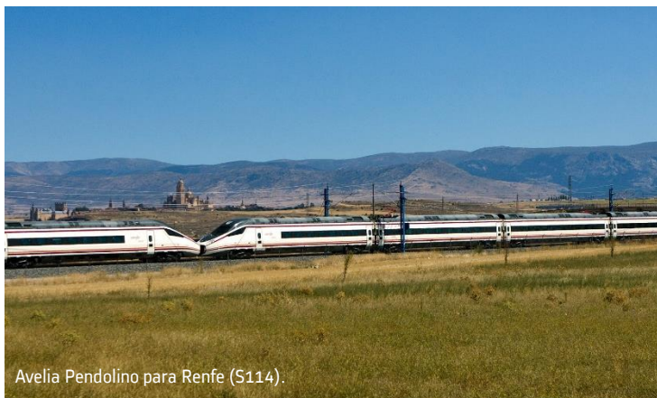
Avelia Pendolino para Renfe (S114).

Uno de cada tres trenes que circulan por España ha sido fabricado por Alstom.