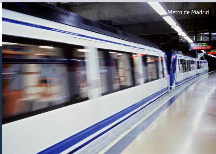
Metro de Madrid