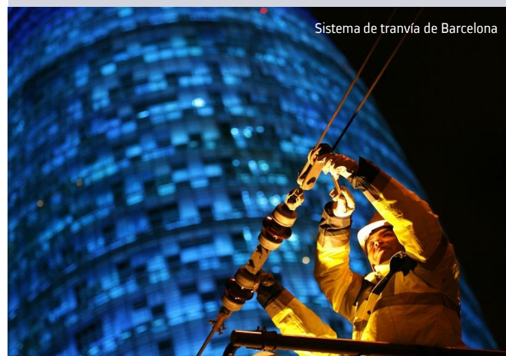
Sistema de tranvía de Barcelona