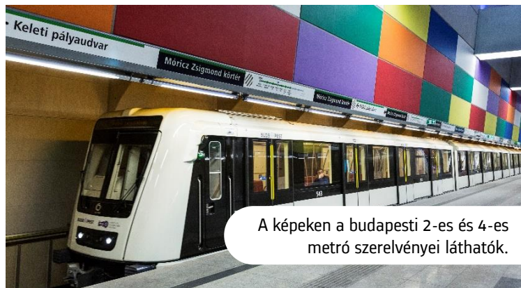
A képeken a budapesti 2-es és 4-es metró szerelvényei láthatók.