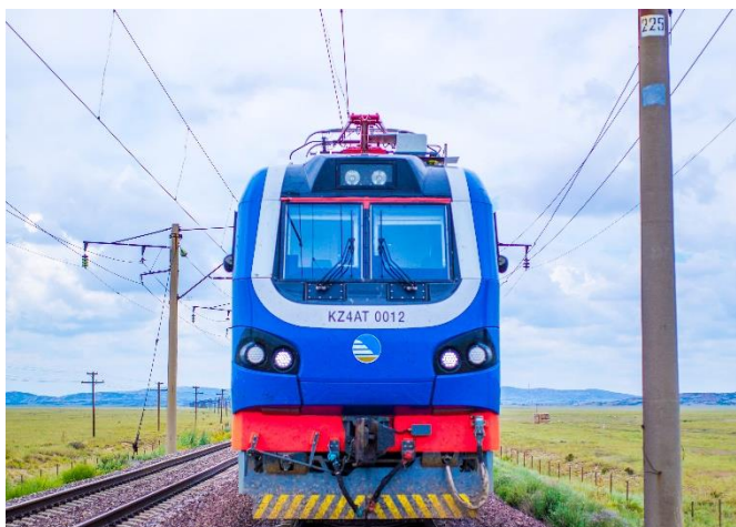
119 односекционных пассажирских локомотивов KZ4AT