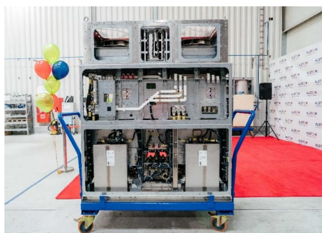
Преобразователи тяговой системы Передовые технологии, надежность и эффективность всего подвижного состава