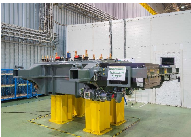
Тяговые трансформаторы с полным диапазоном мощности от 2 до 10 МВА