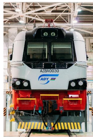
250 двухсекционных грузовых локомотивов KZ8A 40 грузовых локомотивов AZ8A (для экспорта в Азербайджан)