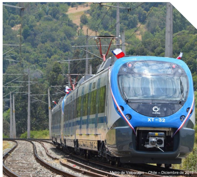
Metro de Valparaíso - Chile - Diciembre de 2015