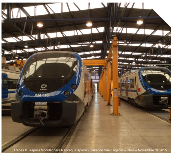
Trenes X'Trapolis Modular para Rancagua Xpress / Taller de San Eugenio - Chile - Noviembre de 2015